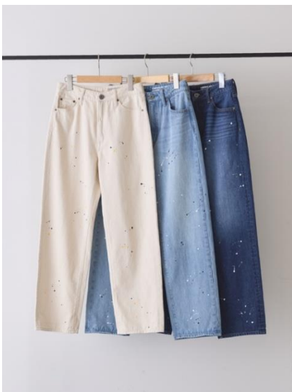
ルーズストレートペイントデニム