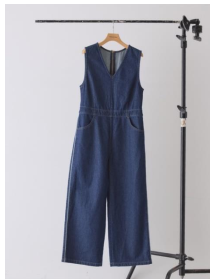
サイドラインオーバーオール