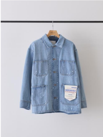
ペイントデニムカバーオールジャケット

取り扱い店舗 : 全 30 店舗 ( https://stripe-club.com/staff/article/detail/?id=dd9q62kt )