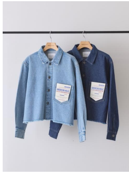
カットオフショート丈デニムシャツ