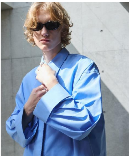
ネクタイ付きワイドスリーブショート丈シャツ