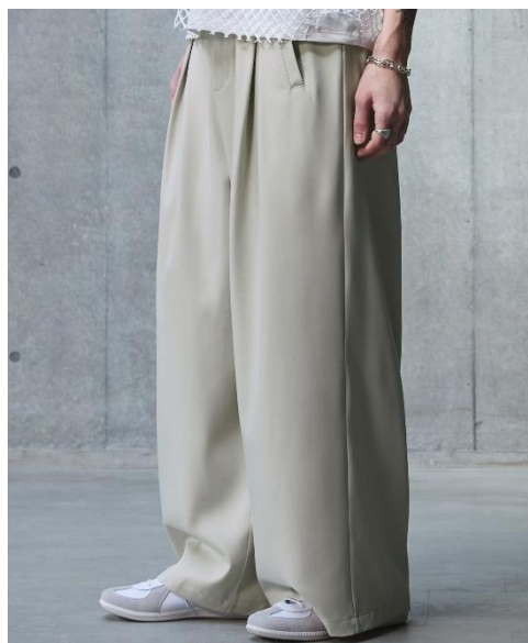
ボックススタックワイドストレートパンツ カラー : Beige/Green/Black サイズ : M/L 価格 : ¥7,700