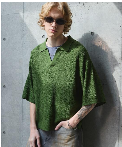
ジャガードスキッパーニットポロシャツ カラー : Ecu/Terracotta/Green/Black サイズ : M/L 価格 : ¥4,950