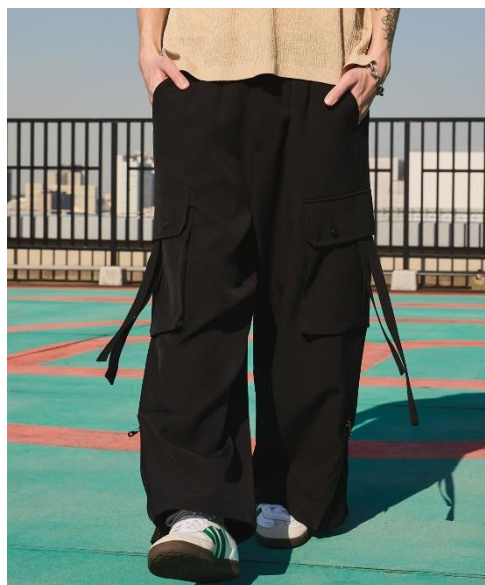
パラシュートパンツ カラー : Charcoal Gray/Black サイズ : M/L 価格 : ¥9,900

＜本件に関するお問い合わせ先＞ 株式会社ストライプインターナショナル 広報担当 TEL : 03-6773-7064 public-info@stripe-intl.com