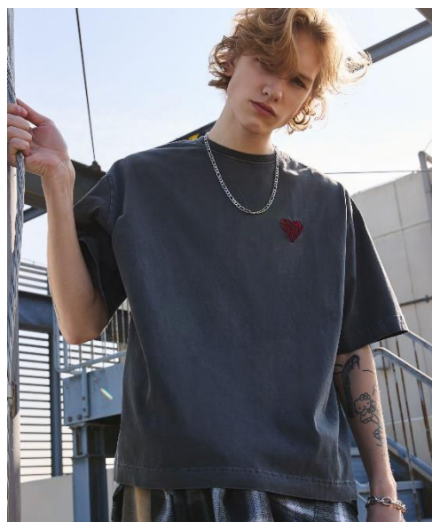
ハートロゴ刺繍ビグメント加工 T シャツ カラー : Black サイズ : M/L 価格 : ¥5,500