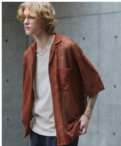
レースオープンカラーシャツ