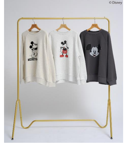
【Mickey&Friends】ビンテージ風スウェット (¥4,990)