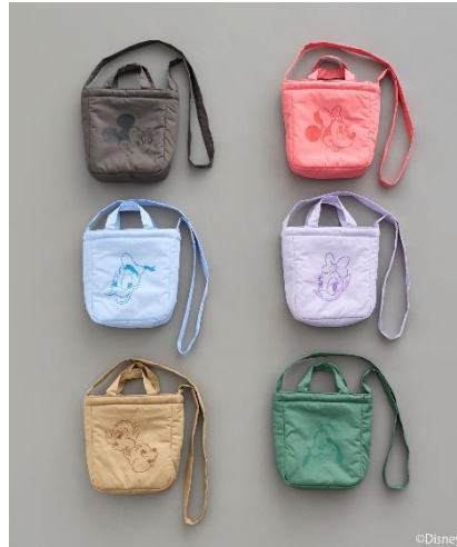
Disney/アソートショルダーバッグ(¥3,300)