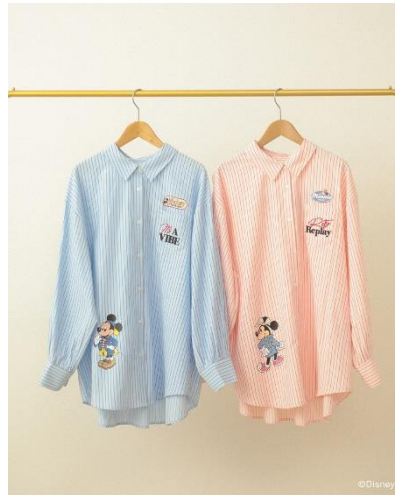
ミッキー&フレンズ/オーバーサイズシャツ(¥4,990)