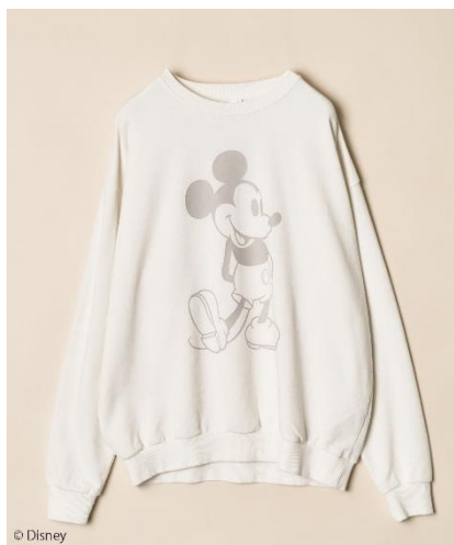
ミッキーマウス/スウェット(¥6,270)

世界中で愛される「ミッキーマウス」がデザインされた、大人のデイリーウェアコレクション。ヴィンテージライクな加工感にクラシックな「ミッキーマウス」を落ち着いたトーンでプリントしました。スウェットライクな程よい厚みと、古着のような加工感が自然な抜け感を演出。大人の日常に馴染む上品なラインアップです。