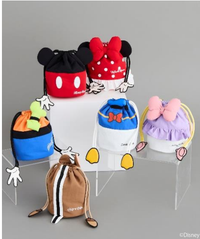
Disney/アソート巾着ポーチ(¥2,970)

「ミッキー&フレンズ」のレトロなアートを使用したシリーズ。ミッキーやミニーをはじめ、おなじみの仲間たちをイメージしたアイテムが勢ぞろい。ぬいぐるみ用のゴムバンドがついたポケット付きミニショルダーや、ポーチ付きの総柄エコバッグ、巾着、ロンT、靴下までラインアップ。お好きなキャラクターのトータルコーデも楽しめます。