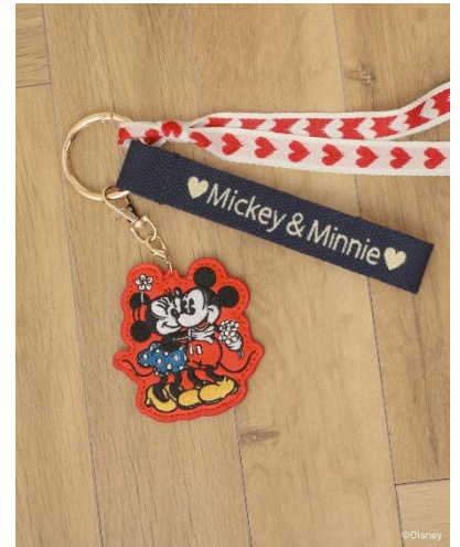
ミッキー&フレンズ/刺繍チャーム(¥2,990)