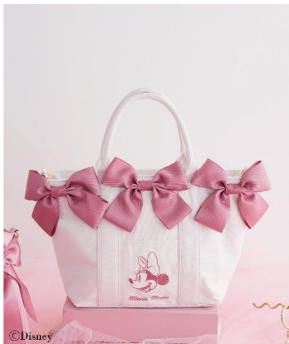
Minnie Mouse/ボリュームリボン 2Way トート(¥9,200)

キャラクターのアートをパッチワーク刺繍で表現したバッグ&ポーチや、アセチ板にプリントしたパーツを使用した華やかなバッグチャームなどをラインアップしています。