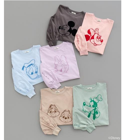
Disney/アソートプリントロン TEE(¥4,400)