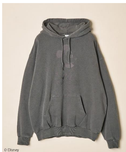
ミッキーマウス/スウェットパーカー(¥6,600)