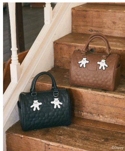
ミッキー/キルティングミニポストバッグ(¥9,200)