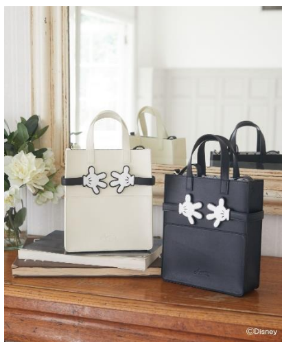
ミッキー/ショルダーバッグ(¥6,600)