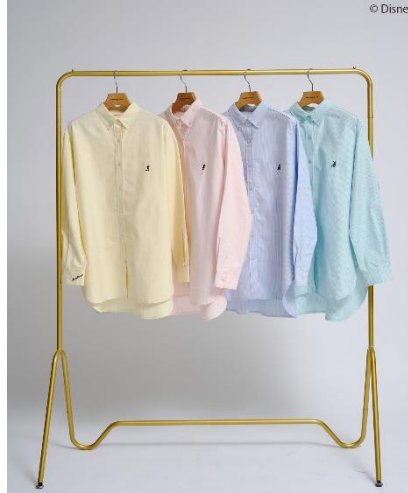
【Mickey&Friends】ボタンダウンシャツ (¥4,990)