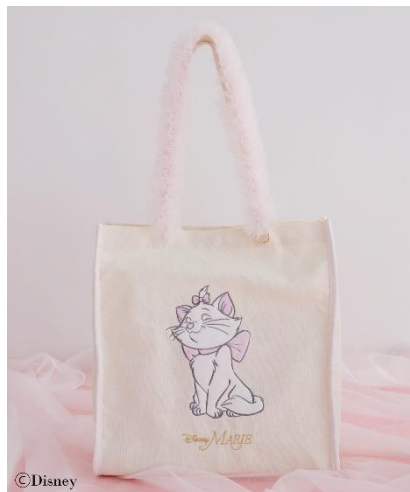
Disney Marie/フルハンドルトートバッグ(¥6,200)