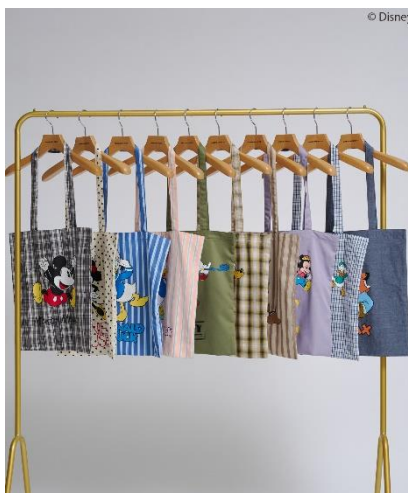
【Mickey&Friends】10Col トート BAG (¥2,990)

10周年を迎える AMERICAN HOLIC から「ミッキー&フレンズ」の特別なコレクションが登場。本コレクションでは「10周年」にちなみ、“10”の大人気キャラクターが大集合した遊び心あふれるアイテム全10型を展開します。