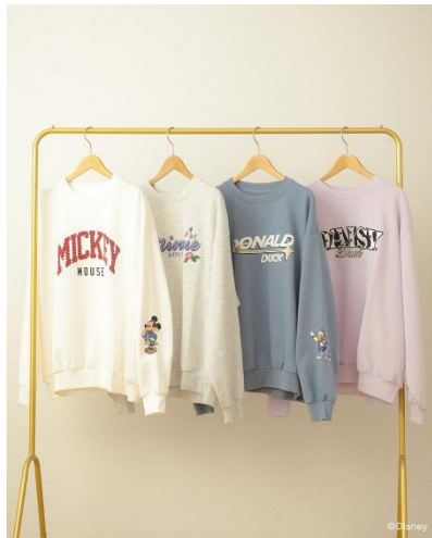
ミッキー&フレンズ/スウェット(¥5,990)

ストライプ柄シャツや抜染デニムの総柄シャツ、ユニセックスで着用可能なスウェットなど、春のお出かけにぴったりなラインアップです。