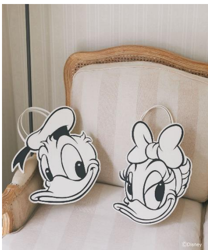
ドナルド/モトーンフェイスバッグ(¥12,900) デイジー/モトーンフェイスバッグ(¥12,900)

キャラクターのフェイスデザインやモチーフを取り入れた、遊び心と可愛らしさが詰まったバッグコレクション。