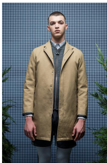
2.MENS BONDING OVERCOAT ボンディング素材のステンカラーコート。フロントがファス ナー仕様でカジュアルな印象。