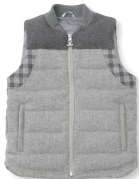
(左) MENS QUILTING VEST