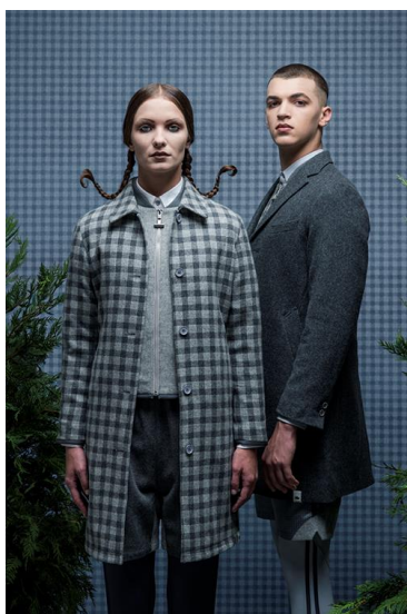
3.WOMENS CHECKED OVERCOAT(左) ブロックチェック柄のステンカラーコート。裏地にはポリエス テルのウィンドウペンチェック柄を使用。