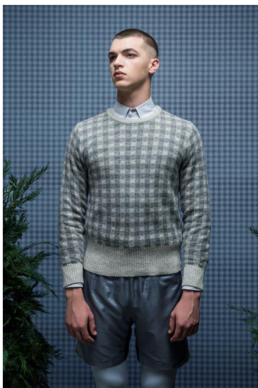
1.MENS CHECK CREWNECK SWEATER ブロックチェック柄のクルーネックセーター。切り替え風の インターシャデザインもポイント。